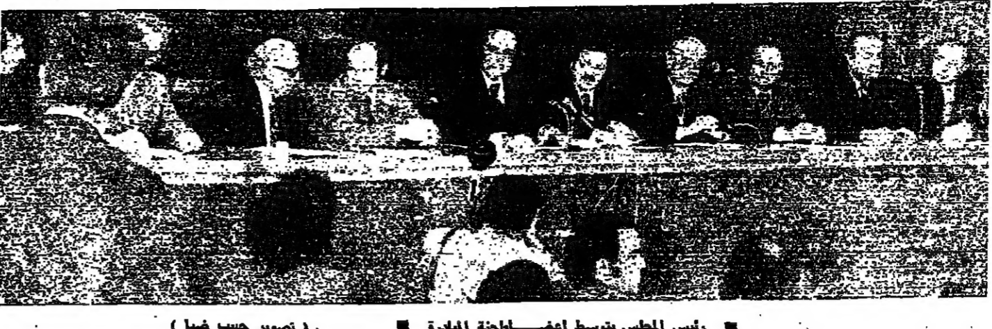
الرئيس الاسعد يلقى بيانه

من يورثهم موزون مكرمين محضين عليهم مبدعين منهم كل حيف وظلم. اننا ندين كل عمل يهدد كرامة الانسان واستقراره وانه ينتال باحاديثهم الى منازلهم يقرب وقت ممكن وان الاحمال اللانسانية التي جرت من تعذيب وتقتل وتهجير لا ترضى بها الاجرة الطبية من اللتاتيين. ونحن بانتظار تحرك الاخبار منهم لاعادة اخوانهم الى منازلهم.